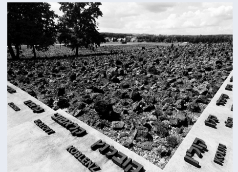
На фото: на місці концтабору в Белжеці в Біблії написано: