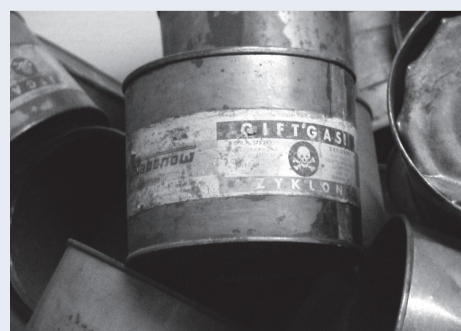
На фото: використана металева тара «Циклону Б»

В цих страшних газових камерах Белжеця, як і інших концентраційних таборах фашисти використовували газ «Циклон Б». «Циклон Б» був розроблений в 1922 році групою вчених під керівництвом Фріца Габера, лауреата Нобелівської премії з хімії. З 1911 року він був керівником Інституту фізичної хімії та електрохімії товариства ім. Кайзера Вільгельма в Берліні, де очолював розробку бойових отруйних речовин і методів їх застосування.